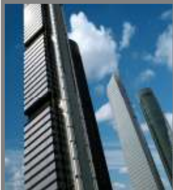
Cuatro Torres Business

La ciudad de Madrid es el centro financiero de España, y la mayoría de los principales bancos nacionales e internacionales tienen ubicada en ella sede central para España y varias sucursales. El núcleo financiero se ubica en el centro de la ciudad, especialmente a lo largo del principal eje norte-sur, Paseo de la Castellana.