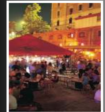
Madrid no duerme