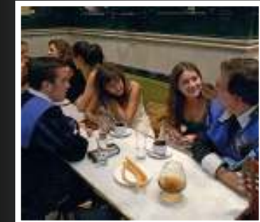
Chocolate con churros en la Chocolatería San Ginés