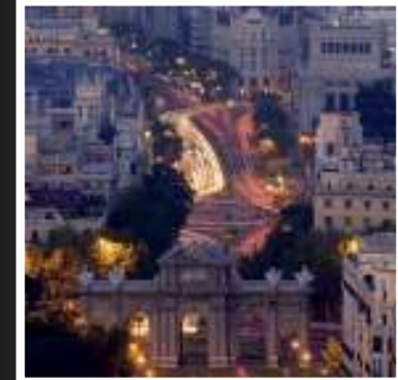
La Puerta de Alcalá y la Calle Alcalá

También, podrás disfrutar de restaurantes emblemáticos de la zona como el Café Gijón o el restaurante El Espejo, donde además ofrecen interesantes descuentos a los alumnos del Centro. Los menús oscilan entre los 15 y los 50 euros.