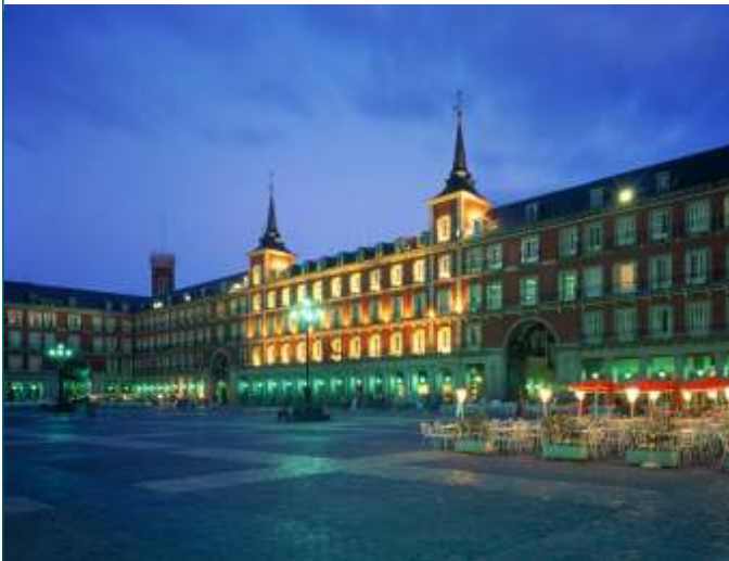
Plaza de Mayor