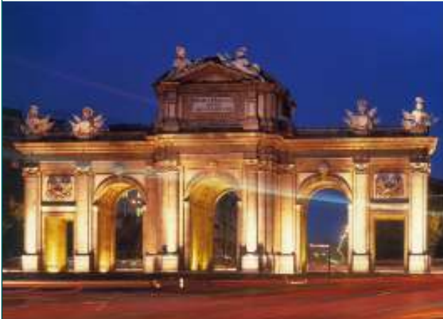
Puerta de Alcalá