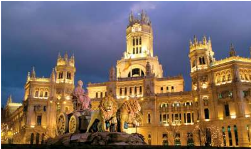
Plaza de Cibeles