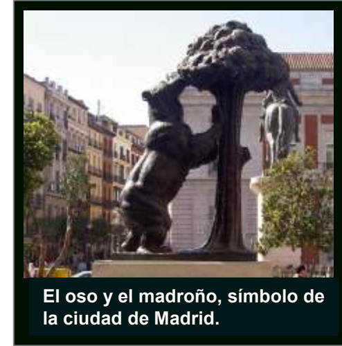
El oso y el madroño, símbolo de la ciudad de Madrid.

Los fármacos se pueden obtener en las farmacias, fácilmente reconocibles por una cruz verde en su exterior. Las farmacias siguen el horario comercial normal, pero también existen farmacias de guardia abiertas las 24 horas.